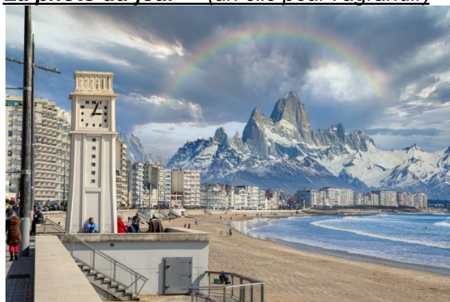
Photo complètement surréaliste des montagnes des Alpes accolées à la baie des sables d'Olonne juste le temps d'une prise de vue. Juste en rêve ! J'ai réalisé ce montage avec le logiciel Luminar4. Il faut bien s'occuper