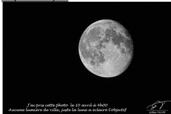
Photo prise le 10 avril à 4 heures

Aucune lumière de ville, juste la lune a éclairé l'objectif