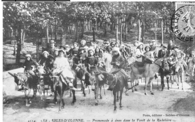
Les Sables d'Olonne en 1921